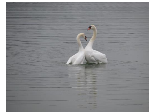
Biti čuječ = biti uspešnejši

Vzemimo si torej čas, da posatnemo bolj čuječi ter tako še bolj ponegujemo tudi svojo osebnost, svojo samopodobo, si privoščimo svojstven način motivacije, odstranimo elemente stresa, postavimo se zase v svoji komunikaciji in sprostimo se ter nadredimo prostor novim mislim v sebi, naredimo prostor biti jaz in sledimo sebi.