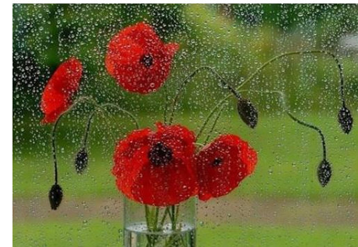
Ustvarjati + kreativno razmišljati = biti jaz

Vzemimo si torej čas, da ponegujemo tudi svojo osebnost, svojo samopodobo, privoščimo si svojstven način motivacije, odstranimo elemente stresa, postavimo se zase v svoji komunikaciji in sprostimo se ter nadredimo prostor novim mislim v sebi, naredimo prostor biti jaz in sledimo sebi.